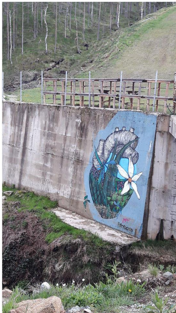
Slika 2: Mural „Srce planine“, autor Jana Danilović

Tema murala treba da korespondira sa sloganom ovogodišnjeg festivala „Srce kuca jako“, celokupnim kontekstom muzičkog festivala u prirodi i okruženjem u kom se nalazi. Tema ekologije je zastupljena i na ovogodišnjem festivalu, sa akcentom na reciklažu, tako da će se dodatnim poenima bodovati radovi koji u svom konceptu predviđaju upotrebu recikliranih materijala.