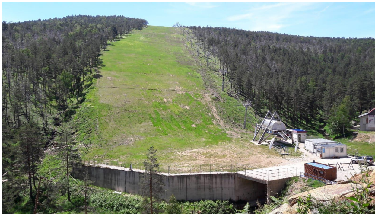
Slika 1: Potporni zid koji se oslikava

Ideja konkursa je da se u okviru festivala Mountain music fest MMF, koji se već četvrtu godinu za redom održava na Divčibarama, nastavi oslikavanje betonskog potpornog zida na dnu ski staze, a iza glavne festivalske bine. Mountain Music Fest je celodnevni porodični i muzički festival, na kojem su pored muzičkih sadržaja jednako važni i drugi- avanturistički, kreativni, umetnički, sportski i dečiji sadržaji. Više o festivalu možete videti na www.facebook.com/mountainmusicfest/ i www.mmf.rs .